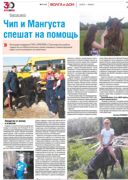
Рисунок 2. Выездные занятия