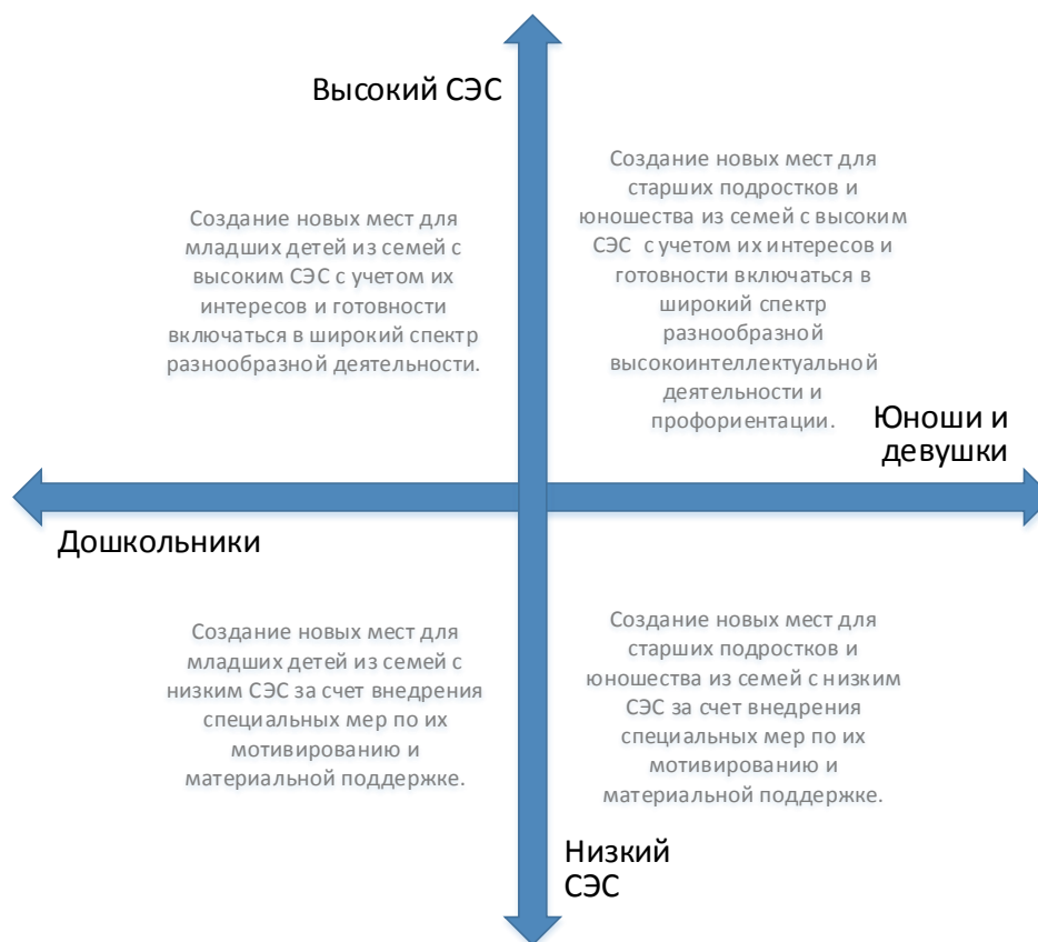
Рис. 5. Шкалы выбора модели создания новых мест по программам художественной направленности с учетом особенностей контингента обучающихся

Вовлечение в программы детей из семей с низким образовательным и культурным уровнем потребует осуществления определенных PR-шагов, поиска мотиваторов для данных детей, в том числе, материальных.