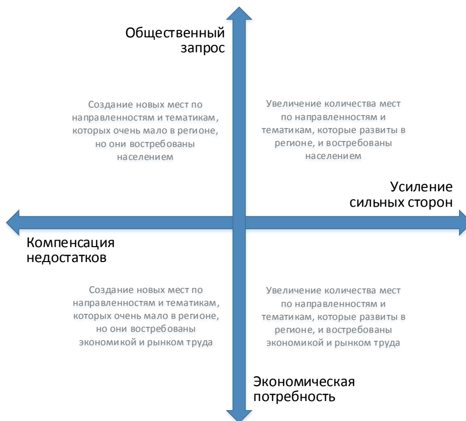
Рис. 2. Шкалы выбора тематики и тактики создания новых мест дополнительного образования