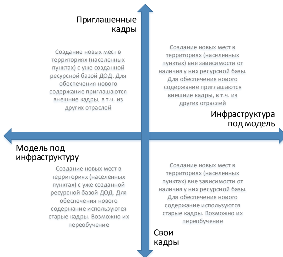
Рис. 6. Шкалы выбора модели инфраструктурного и кадрового обеспечения для типовой модели создания новых мест дополнительного образования

Следует отметить, что механизмы инфраструктурного и кадрового обеспечения не существуют в их полярных вариантах. Решения даже в рамках реализации одной модели будут различны. Анализ перечисленных выше характеристик позволяет сделать эти точечные решения более точными и эффективными.