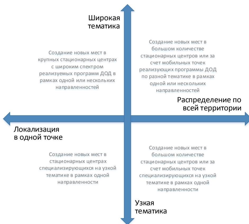
Рис. 3. Шкалы выбора масштаба и формы реализации новых мест по программам ДОД

При невыполнении хотя бы одного из них возникает необходимость пространственного распределения реализуемой модели через мобильные или сетевые решения.