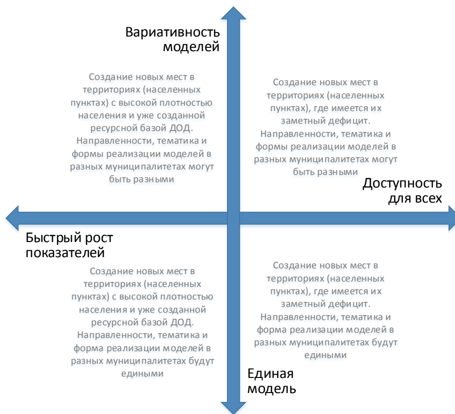
Рис. 4. Шкалы выбора модели создания новых мест с учетом актуальной управленческой политики